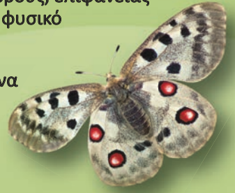
Parnassius apollo Είδος απειλούμενο με εξαφάνιση (IUCN)

Στα τέσσερα διαφορετικά επίπεδα της έκθεσης οι επισκέπτες έχουν τη δυνατότητα να περιηγηθούν στα «Μεγαδιорάματα» , δηλαδή ρεαλιστικές και σε φυσικό μέγεθος αναπαραστάσεις της φύσης, στο Γιγάντιο Δεινοθήριο , στα Απολιθώματα , στο Ζωντανό Μουσείο , στον Ερευνότοπο , στον Εγκέλαδο , στην Αίθουσα Πολυμέσων και στο Χώρο των Περιοδικών Εκθέσεων . Παράλληλα από το Νοέμβριο 2013 έως τον Φεβρουάριο 2014 φιλοξενείται σε χώρους του Μουσείου, η περιοδική έκθεση ΦΩΤΕΙΝΑ ΜΥΣΤΗΡΙΑ .