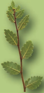
Zelkova abelicea , Ενδημικό δέντρο της Κρήτης

Στο ΕΠΙΠΕΔΟ +1 περιηγηθείτε σε δύο ακόμη εντυπωσιακά Μεγαδιорάματα που φιλοξενούν τα οικοσυστήματα των Κωνοφόρων δένδρων και των Ψηλών βουνών της Μεσογείου. Η ραβδωτή ύαινα, το τσακάλι, το πλατόνι, η στεπογερακίνα, ο σφηκιάρης, αλλά και ο εντυπωσιακός λύγκας χαρακτηρίζουν τα κωνοφόρα δάση με κέδρα, έλατα και κυπαρίσσια, ενώ στα οικοσυστήματα των ψηλών βουνών εντυπωσιάζουν ο αίγαγρος, το αγριόγιδο και το αγρινό της Κύπρου. Γνωρίστε μερικά από τα μοναδικά Απολιθώματα θηλαστικών που βρέθηκαν στην Κρήτη. Στο επίπεδο αυτό μπορείτε να ψυχαγωγηθείτε μαθαίνοντας με τις εκπαιδευτικές διατάξεις οπτικής , τον σκοτεινό θάλαμο , τις τεχνολογίες 3D και τα Οπτικά Παράδοξα (από την περιοδική έκθεση ΦΩΤΕΙΝΑ ΜΥΣΤΗΡΙΑ ).